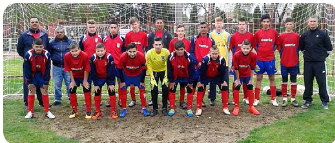
Dobogós helyért játszó serdülő csapatunk