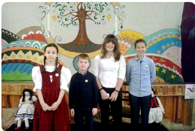
Irinysis mesemondók Konyáron

14. alkalommal rendezték meg április 19-én, Konyáron az „Égig érő fa” járási mesemondó versenyt . 15 iskola gyermekei varázsolták el a jelenlévőket a mesék birodalmába. Intézményünket a helyi versenyen legeredményesebbnek bizonyult diákok képviselték.